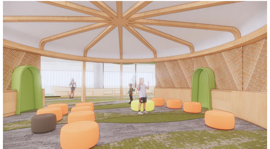
Installation partagée BPO-BAC, Art public autochtone