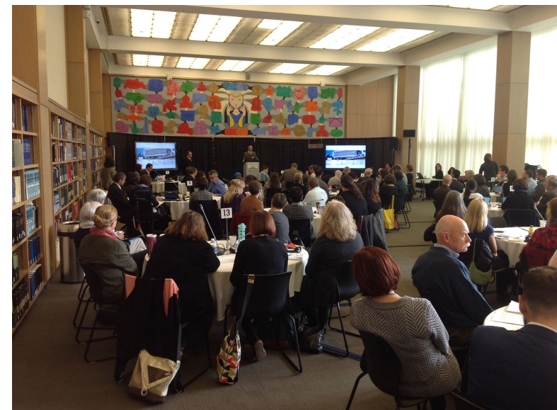
Assemblée fondatrice de la SNPD, octobre 2016

Ressources publiées : déclarations de droits, formats de fichiers, pratiques optimales, résultats d'enquête.