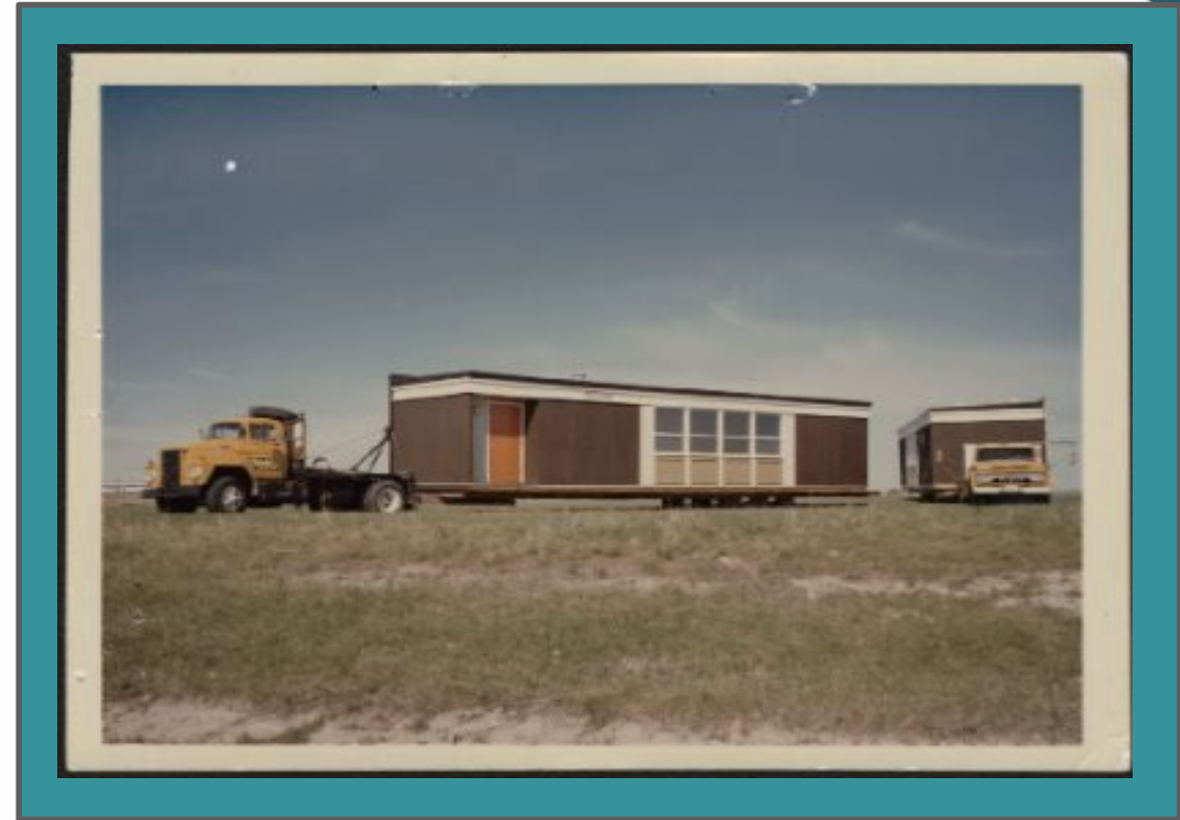
École de jour préfabriquée en cours de livraison sur le site, Forest, Ontario, vers 1967, e011794878