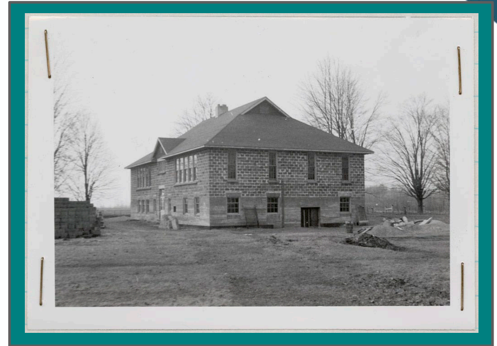
École New Caradoc Day, Mount Elgin, Ontario, 1948